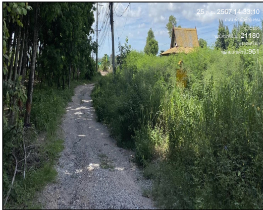
ป้ายเตือนแนวทอส่งก๊าซธรรมชาติ