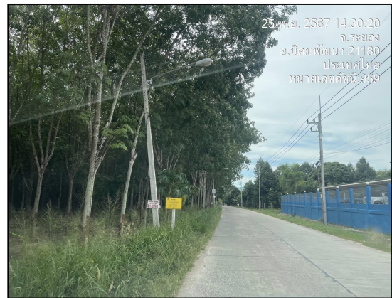
แนวทอก๊าซฯ ริมถนนท้องถิ่นบ้านมาบข่า-สำนักอ้ายยอน มุ่งไปยังทางหลวงแผ่นดินหมายเลข 3191