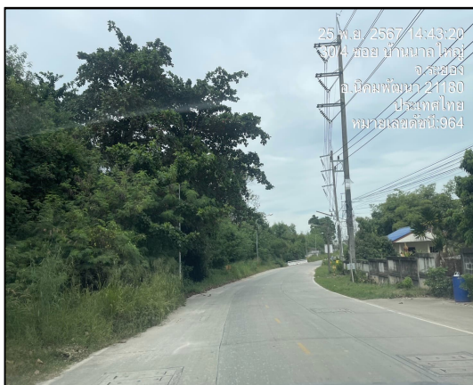
แนวทอส่งก๊าซฯ บริเวณถนนท้องถิ่นบ้านมาบข่า- สำนักอ้ายยอนตัดกับทางหลวงแผ่นดินหมายเลข 3191