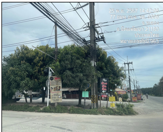
แนวทอก๊าซฯ ริมถนนท้องถิ่นบ้านมาบข่า-สำนักอ้ายยอน มุ่งไปยังทางหลวงแผ่นดินหมายเลข 3191