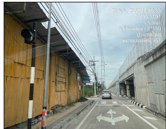
แนวทอส่งก๊าซฯ ริมถนนท้องถิ่นบ้านมาบข่า